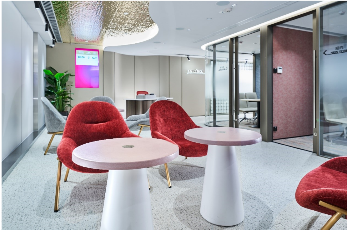
中信銀行(國際)尖沙咀 ESG 旗艦分行會客室桌面由混合了超過 30% 以上的辣椒葉和辣椒籽等環保物料製造而成。