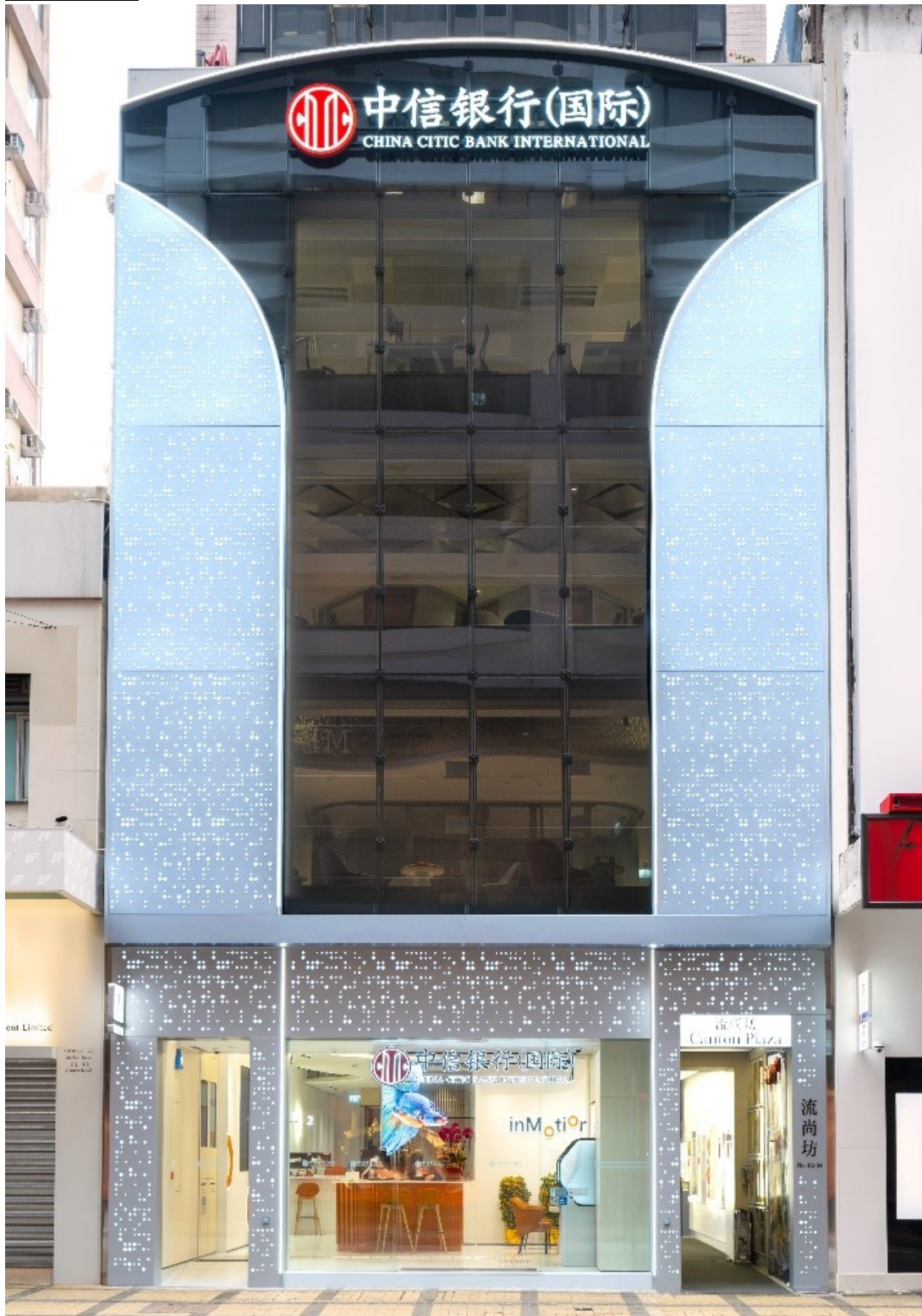
中信銀行(國際)尖沙咀 ESG 旗艦分行是全港首間採用太陽能玻璃裝置的銀行分行。